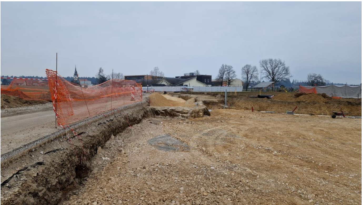
Nepredvidena dela pri gradnji obvoznice

Žal se bo dokončanje gradnje obvoznice Vodice, proti Poslovni coni Komenda zamaknilo v poletje 2023